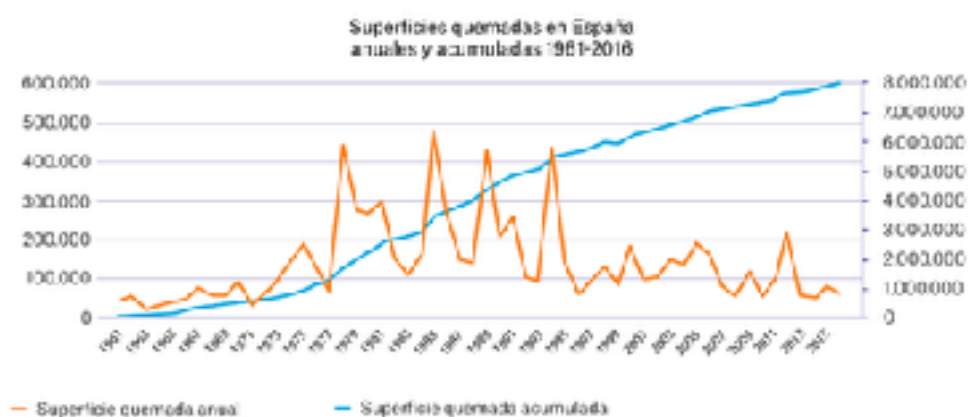
Gráfico 1. Evolución de las superficies afectadas por los incendios forestales en España 1961-2016

Fuente: elaboración del Observatorio de la Sostenibilidad, 2016 a partir de datos del Ministerio de Agricultura Pesca Alimentación y Medio Ambiente (MAPAMA).